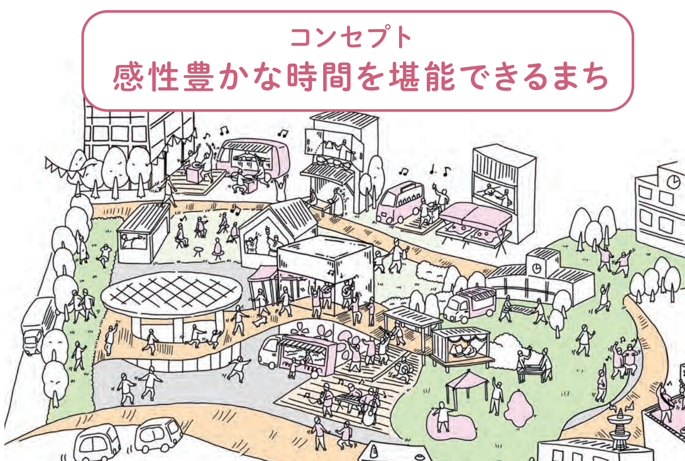
東桜エリアマネジメント構想 ver.1