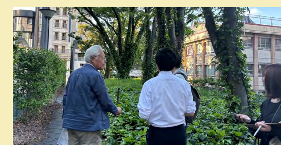
▲TCA#1 東桜を歩こうの会

今年度から、会議室を飛び出して行う小さなアクション (TCA) を始めました。社会実験にむけて、まちの清掃やなど勉強会メンバーがラフに参加できる活動です。