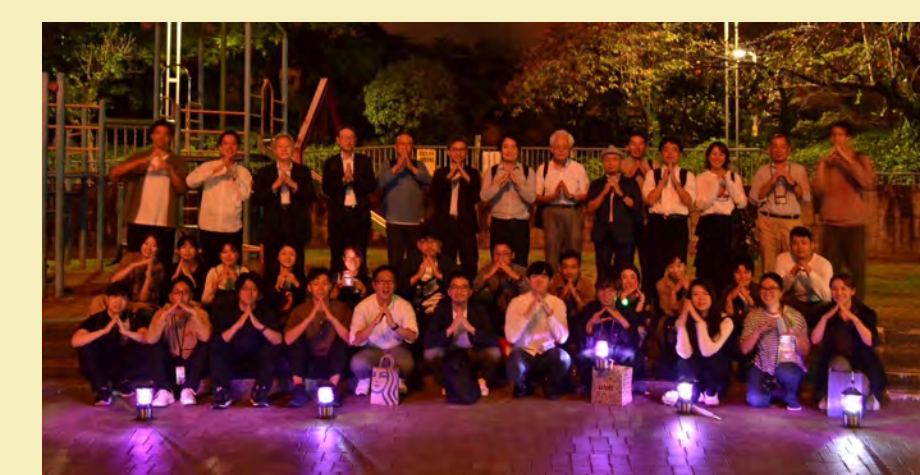
▲TCA#3 栄公園でのんびりしようの会