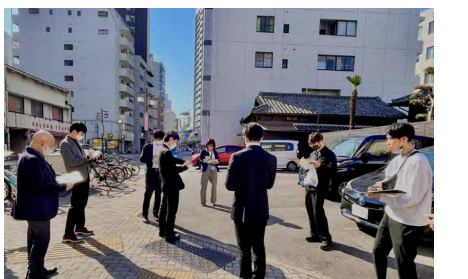
まちあるきの様子