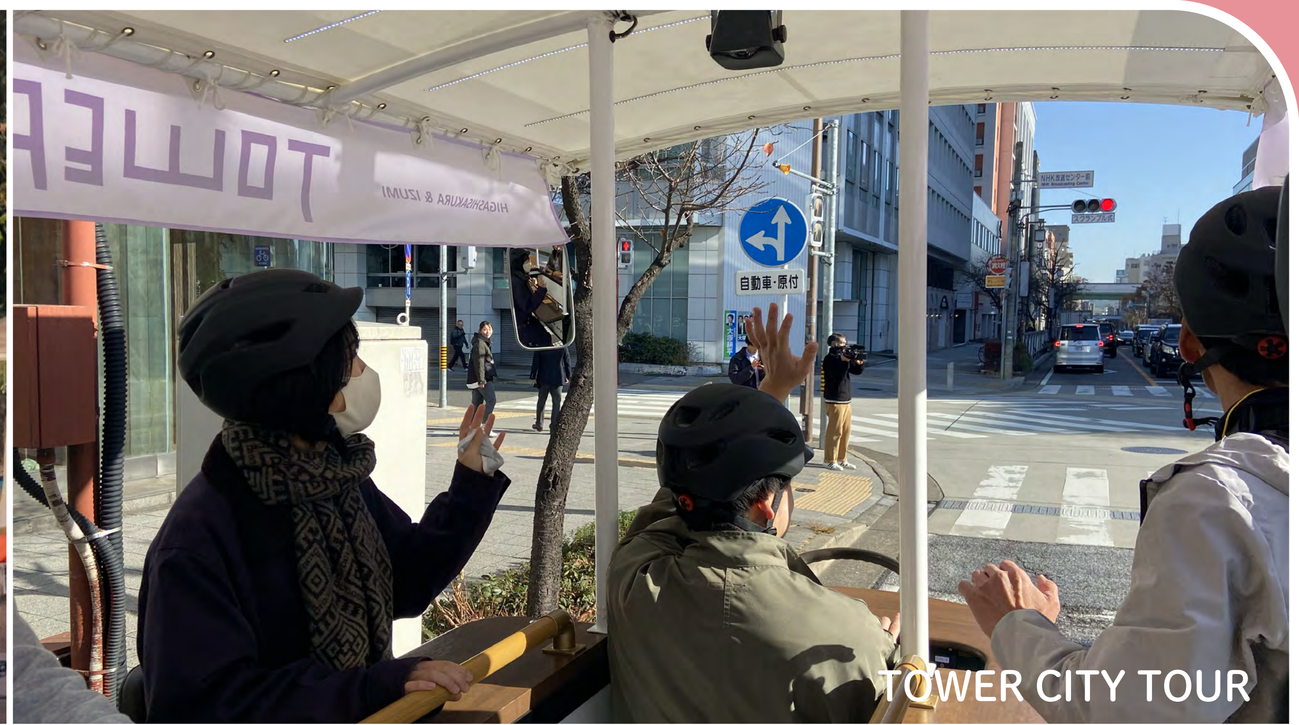
TOWER CITY TOUR