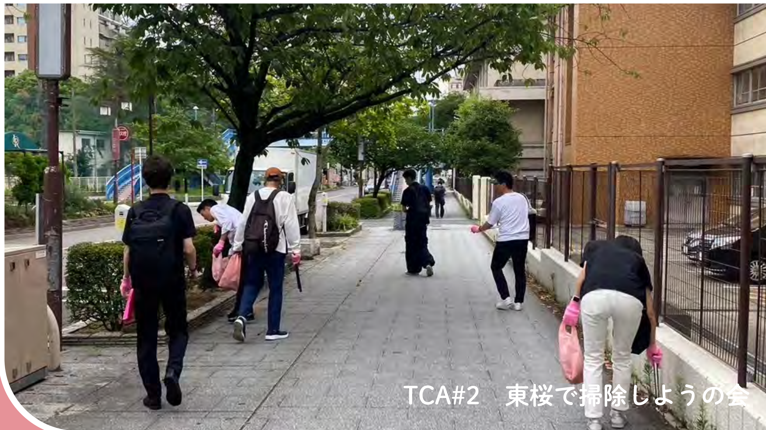
TCA#2 東桜で掃除しようの会