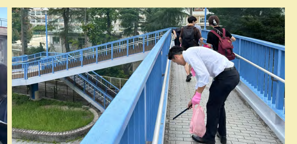
▲TCA#2 東桜を掃除しようの会