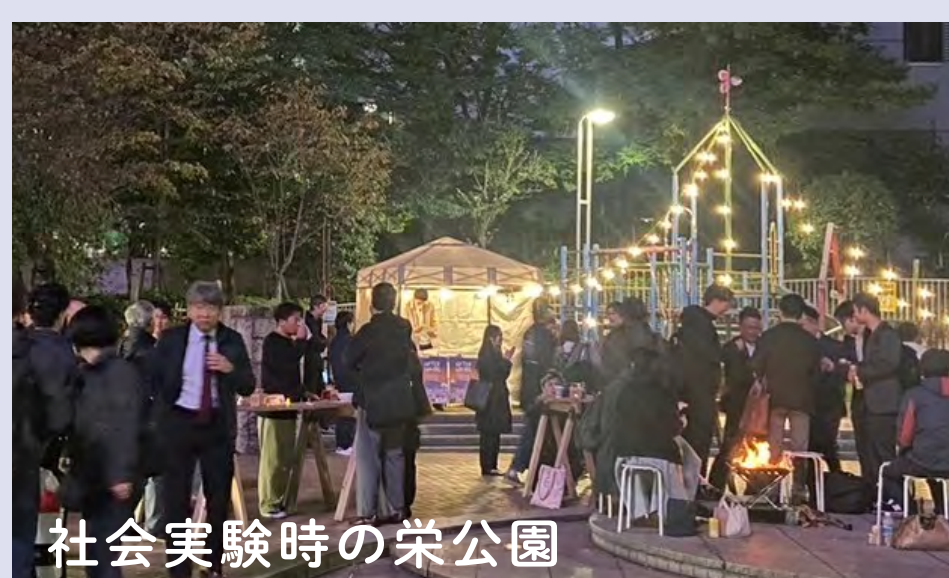
社会実験時の栄公園