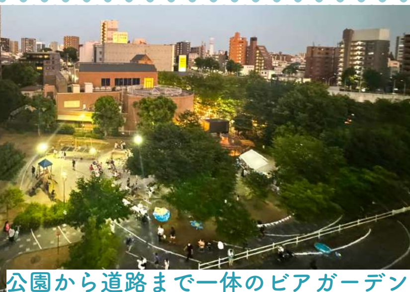
公園から道路まで一体のピアガーデン