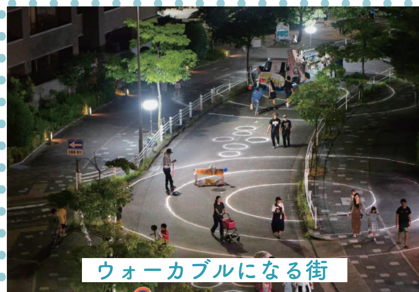
ウォークアブルになる街