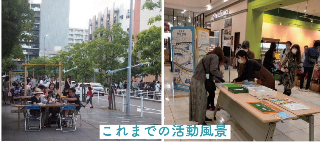
これまでの活動風景

住みやすく、楽しいまちの形成とエリアで商いを営む事業者の収益性向上の両立をめざします。