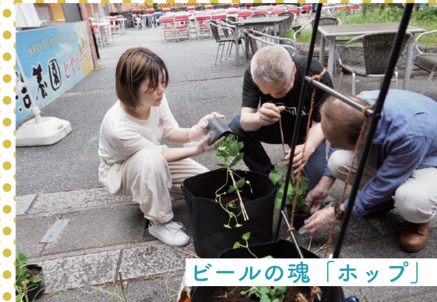
ビールの魂「ホップ」を植えるCAN PLANT!

地域のビジョン「CAN PLAY TSURUMAI・CHIKUSA」を目指してできることからアクションを企画しています。