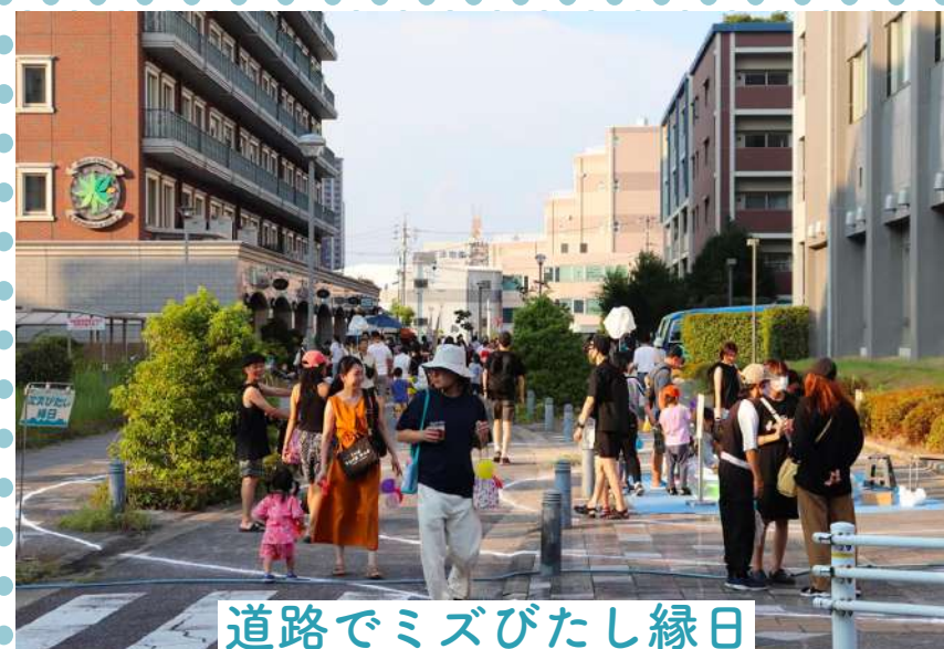
道路でミズびたし緑日