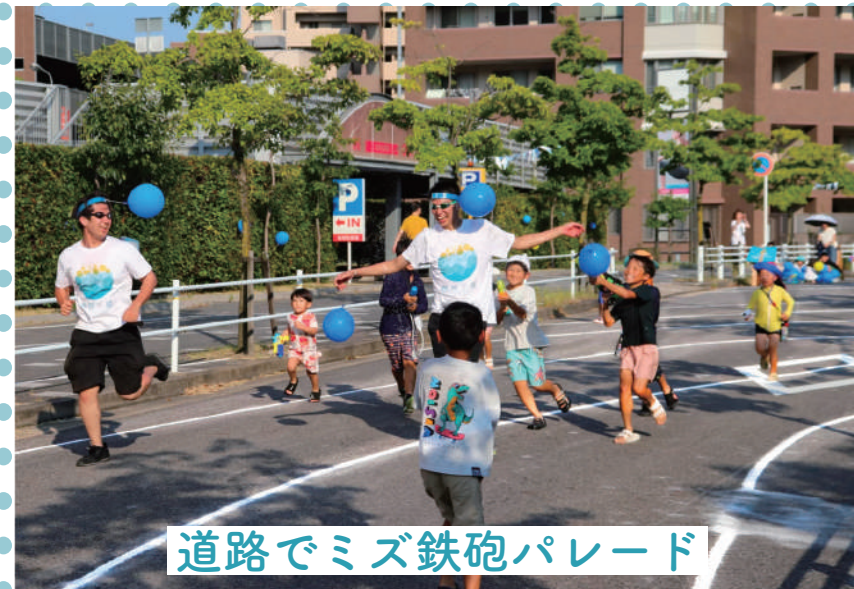
道路でミズ鉄砲パレード