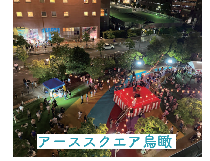
アーススクエア鳥瞰

千種アーススクエアを中心とした、千石学区・鶴舞公園の周辺地域を対象とし、まちづくりをおこなっています。