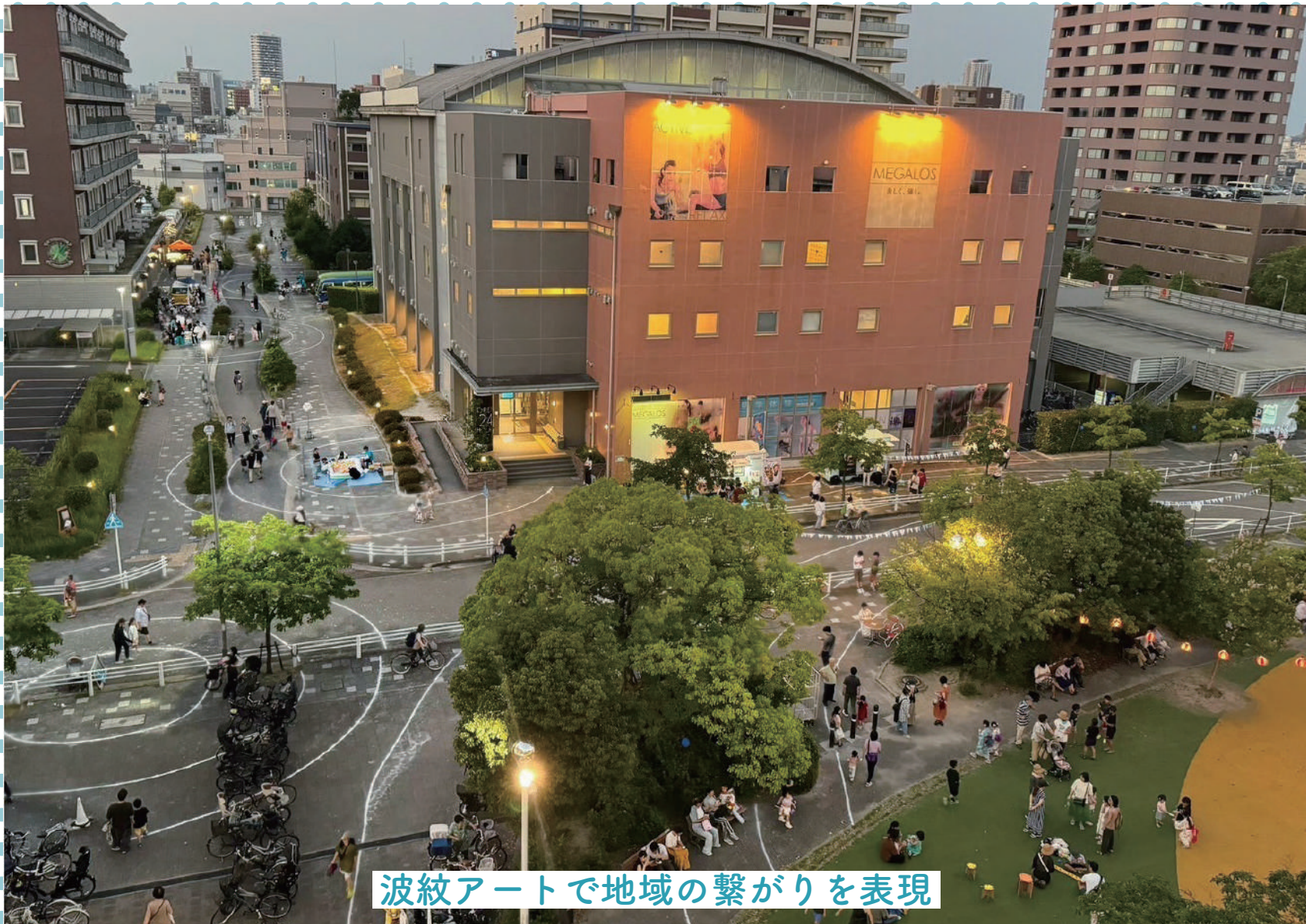
波紋アートで地域の繋がりを表現

地域の水をテーマに今年も「ミズまつり」を開催しました。歩行者天国の社会実験をおこない、道路上で水遊びなどを実施しました。また、公園ではピアガーデンを行いました。