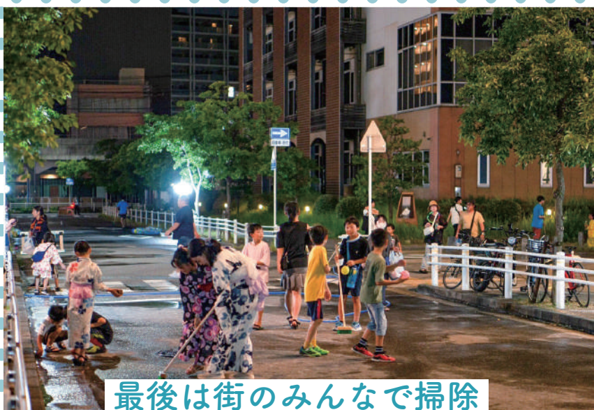
最後は街のみんなで掃除