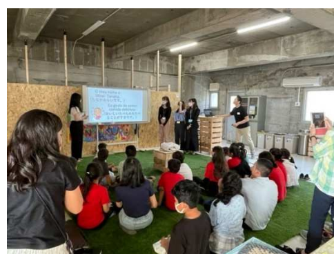
ブラジル人学校との交流会