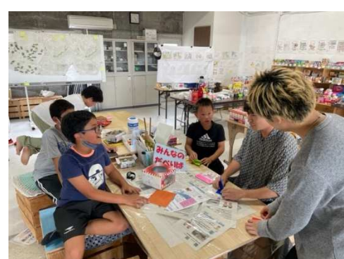
世代を超えた交流も生まれる