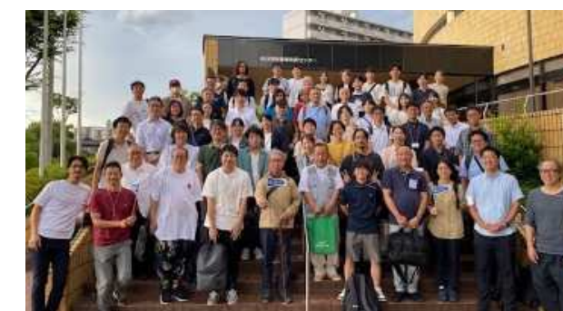
第1回世界団地サミットに参加