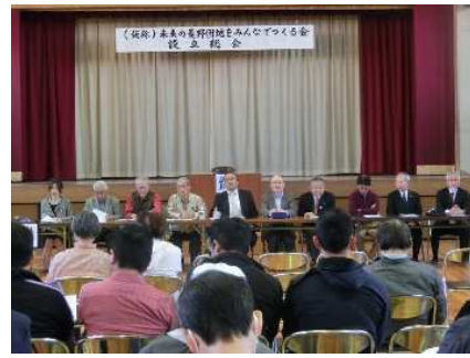
菱野団地再生計画検討委員会 (地域住民や市民団体、民間企業等17名、計6回)

住民バスを契機として3つのブロック(自治会)と一緒に 菱野団地内の課題解決に取り組む体制ができてきた!