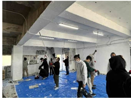
壁や天井を塗り替え