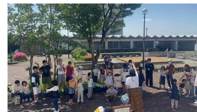
他団体と連携したイベントやマルシェの開催