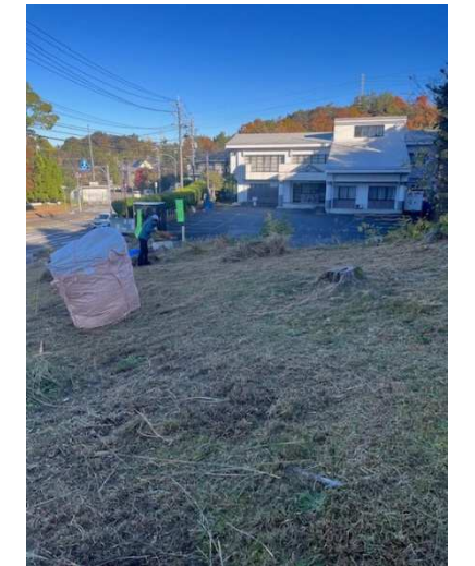
活動資金を生み出すために市から団地内の草刈りの委託を受ける