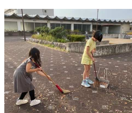
子どもお手伝いカードの実施